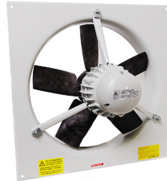
Abb. SW 404 TK

Antriebsmotor mit völlig geschlossenem Gehäuse IP55, Strahlwasser- und staubgeschützt. Speziell entwickeltes Laufrad für große Volumen-Leistung bei geringem Stromverbrauch. Schutz durch eingebaute Thermokontakte. Ausgezeichnete Regeleigenschaften.